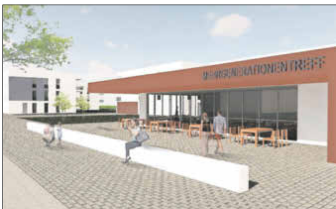
Der Entwurf des neuen Mehrgenerationentreffs.

Stefanie Rückauf Presse- und Öffentlichkeitsarbeit/ Stadtmarketing