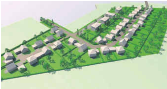
Die favorisierte zweite Variante.

Er regte die Option an, den Investor in den Stadtrat einzuladen und sich den Entwurf dann noch einmal praktisch erläutern zu lassen. Nach weiteren positiven Meldungen wurde der 2. Variante als Planungsgrundlage einstimmig zugestimmt.