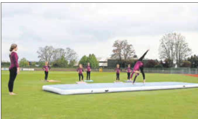
Turnerinnen der SG Union Sandersdorf in Aktion