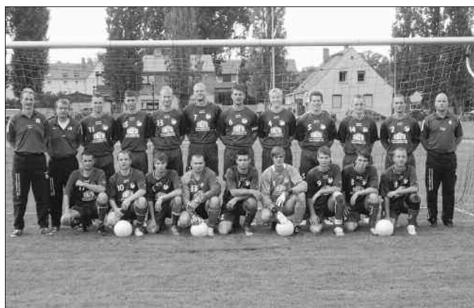
1. Männermannschaft TSV Blau-Weiß Brehna 2009/2010 Kreisliga Ost

Ich wünsche der 1. und 2. Mannschaft das es eine erfolgreiche Saison 2009/2010 für den TSV Blau-Weiß Brehna wird.