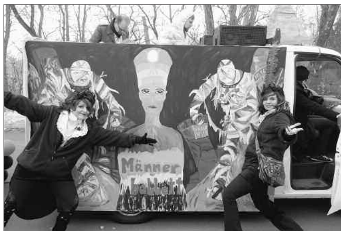
Wagendekoration für das „ Sandersdorfer Männerballett „

Am 7. Februar 2010 war es endlich so weit. Der „Sandersdorfer Karnevalsverein“ veranstaltete traditionell wie in jedem Jahr seinen allseits beliebten Karnevalsumzug. Begleitet von Stimmungsmusik und vielen Süßigkeiten stieg die Feierlaune der Narrinnen und Narren am Straßenrand stetig an. Natürlich wollte der Jugendclub auch seinen Beitrag leisten, um sich hier positiv zu präsentieren. So wurden von den Jugendlichen und deren Betreuern die Gestaltungselemente für mehrere Festwagen angefertigt.