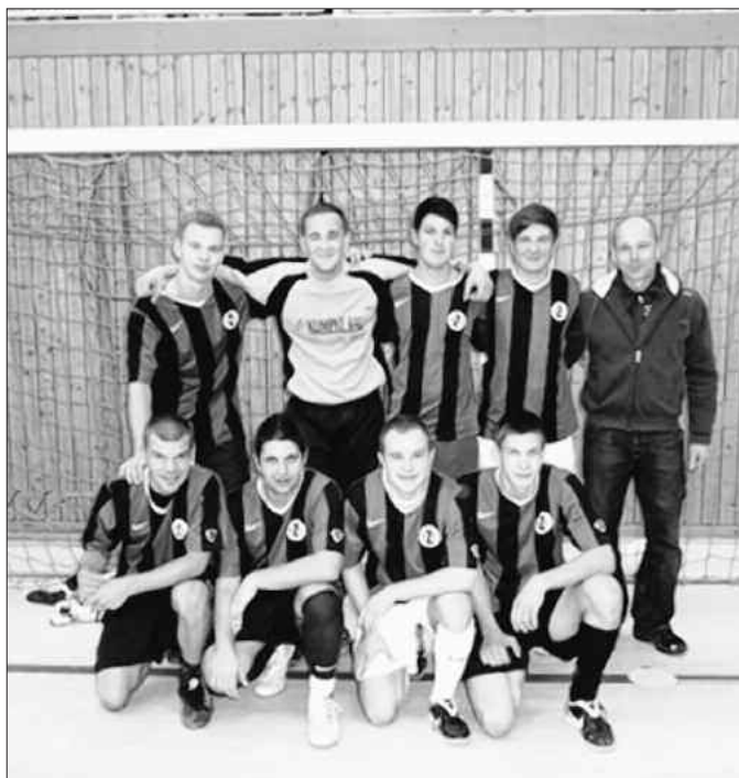
So sehen Sieger aus: Die Zschernitzer holten sich den Siegerpokal dieses Hallenfußballturniers.