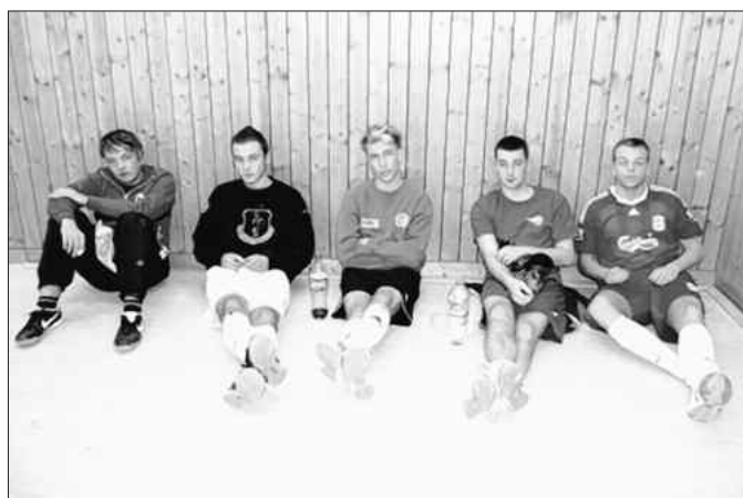
Leicht deprimierte Gesichter beim Team Celecao nach dem verlorenen Finale