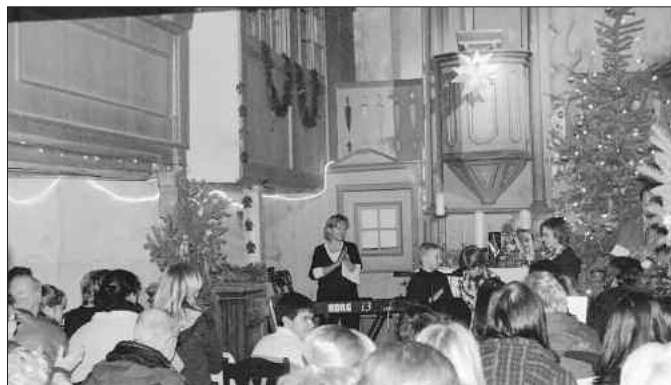
Viele Kinder konnten in der Beyersdorfer Kirche ihr Können darbieten.

Besucher daran zeigte, dass man statt zuzuhören, noch viel lieber mitsang. Abwechslung brachten weihnachtliche Gedichtvorträge, die ebenfalls von Beyersdorfer Kindern aufgesagt wurden. Das Highlight in der kleinen Kirche stellte der Kinderchor der Comeniusschule Bitterfeld dar. Mit viel Begeisterung ging das zweite Weihnachtskonzert zu Ende. Nach dem Konzert wollte sich jedoch nicht gleich jeder von diesem Ort trennen. Für diese bot der Förderverein etwas weihnachtliche Verköstigung. Das Übrige bewirkte die Kirche von selbst. Neuen Gästen bot sie viele Ecken zum Entdecken und treuen Teilnehmern genügend Neues um mit offenen Vereinsmitgliedern ins Gespräch zu kommen.