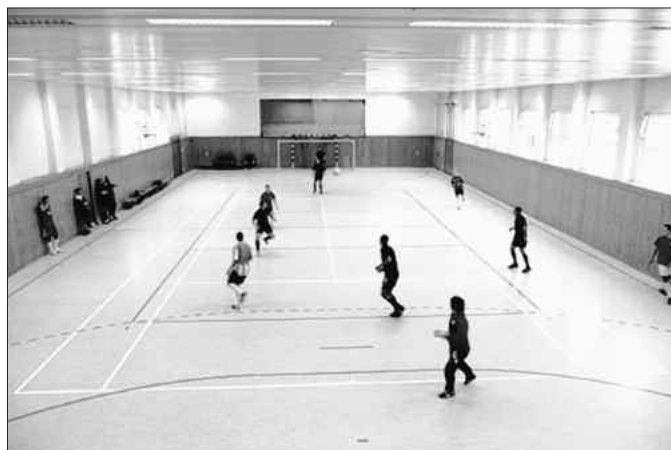
Munteres Treiben auf dem Brehnaer Hallenboden

Auf alle Fälle spiegelte dieses prima organisierte Fußballturnier kurz vor den Feiertagen erneut das gelungene Miteinander der Jugend in der noch jungen Stadt Sandersdorf-Brehna wieder und wird in nicht allzu ferner Zukunft seine Fortsetzung finden.