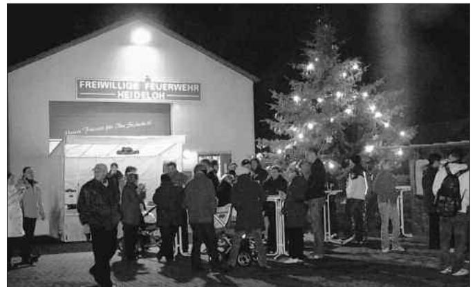
Weihnachtliche Stimmung vorm Gerätehaus Heideloh

Selbst ein paar Krümel Schnee erhielten wir zur Krönung des Abends vom Himmel.