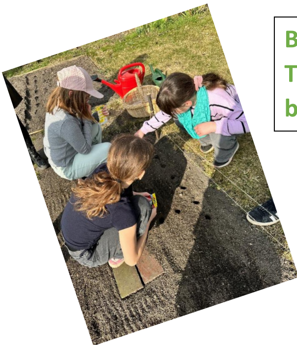
Beete und Töpfe bepflanze